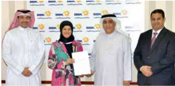
Bahrain Medical Society