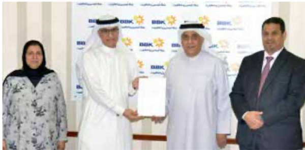
Supreme Council for Women