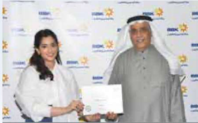
Al Yasia Al BinAli Retail Banking