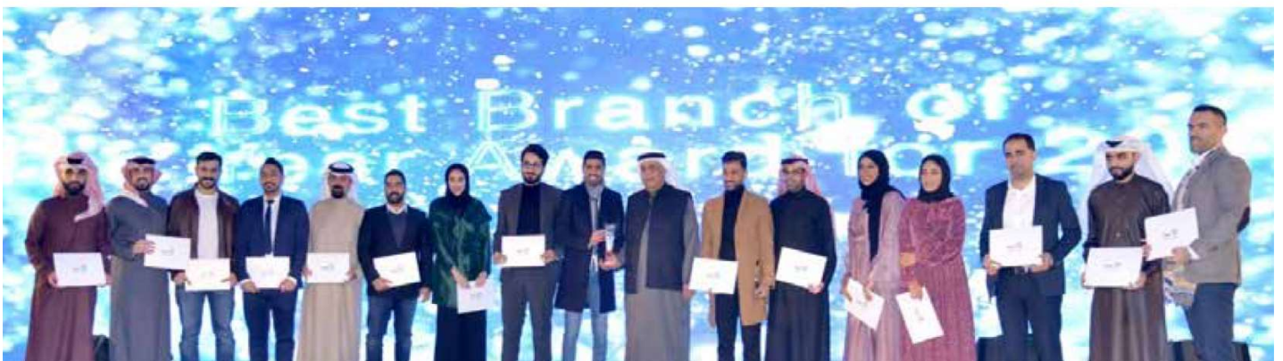
Budaiya Financial Mall