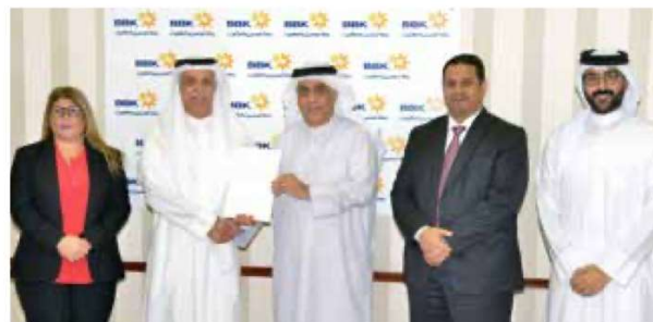
Bahrain Parents Care Home