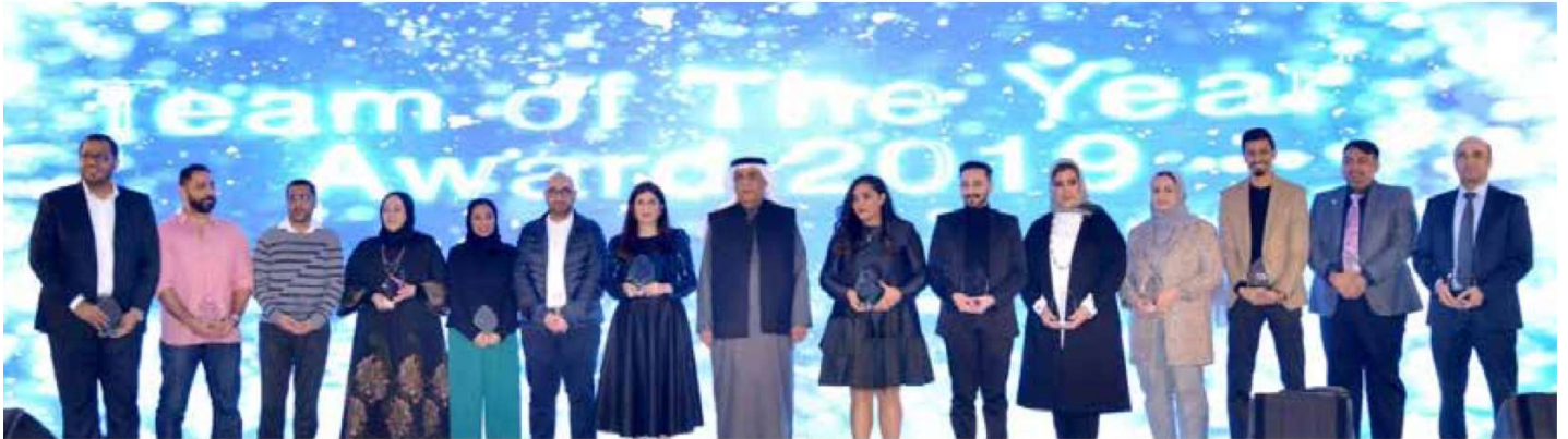
The Agile Team