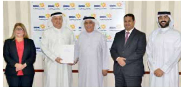
Al Rahma Centre