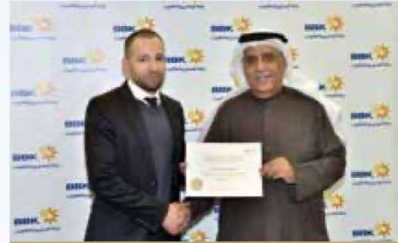
Mohamed Al Haddad International Banking