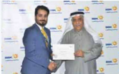
Isa Al Hashimi Retail Banking