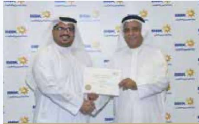
Isa Al Samaim Retail Banking