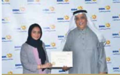
Bayan Makhloq Financial Planning and Control