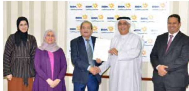
Bahrain Cancer Society