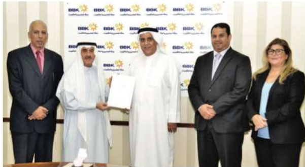
Bahrain Parents Care Society