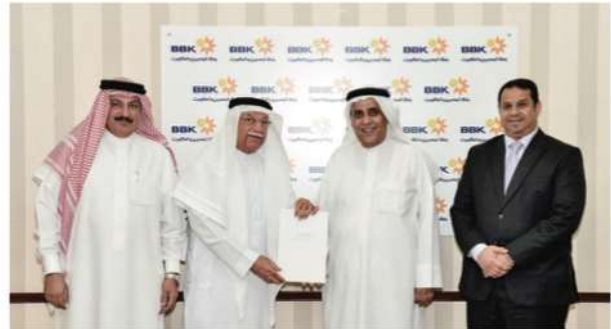
Bahrain Down Syndrome Society