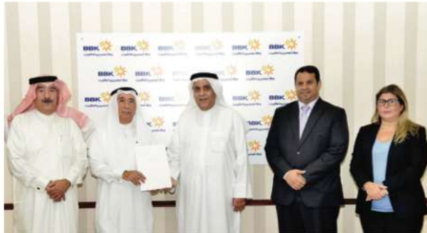
Bahrain Philanthropic Society