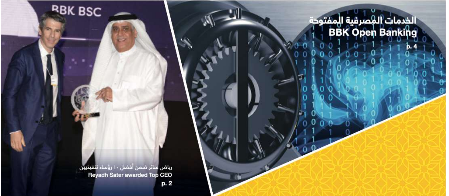
رياض ساتر ضمن أفضل ١٠ رؤساء تنفيذيين Reyadh Sater awarded Top CEO p. 2

الإصدار ٤٦، يوليو ٢٠١٩ Issue 46, July 2019