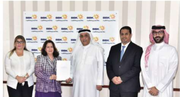
Isa Bin Salman Education Charitable Trust