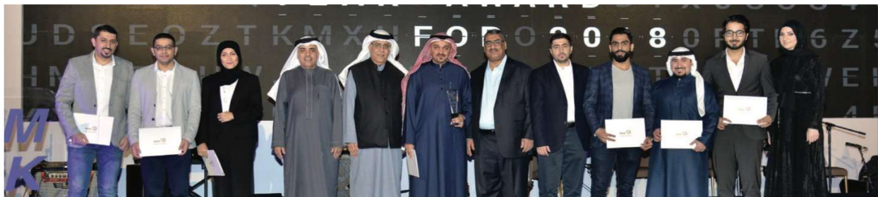
Hamad Town Branch