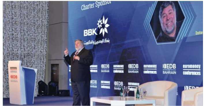
Steve Wozniak Apple Co-founder