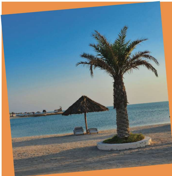
Al Dar Islands

The Kingdom of Bahrain has been ramping up its tourism game during the past few years, with so much more events and investment in a new airport terminal. All to increase traffic into the island. This tells one thing; Bahrain is now way more exciting than ever before.