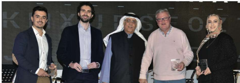
Fixed Income Team