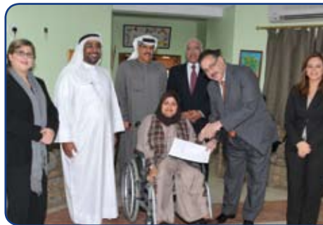
Bahrain Mobility International

وقد تم حفل تدشين الحافلة يوم الثلاثاء الثامن من ديسمبر في مقر المعهد في مدينه عيسى وقد اشتمل الحفل على فقره غنائيه مميزه من طلاب المعهد. وفي ختام البرنامج واحتفالاً باليوم العالمي للمعاقين الذي يصادف الثالث من ديسمبر من كل عام والعيد الوطني شارك البنك فرحه الطلبة بهاتين المناسبتين بتقديم هداية تذكاريه.