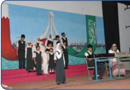
Saudi Bahraini Institute for the Blind

The inauguration ceremony was held on Tuesday, the 8th of December in the Institute's Headquarters at Isa Town. The ceremony included a distinct singing passage performed by the students of the Institute. At the end of the program and to celebrate the International Day for the Disabled, on the 3rd of December every year, and the National Day, the Bank participates with the students in these joyous occasions and gifted them memorabilia gift.