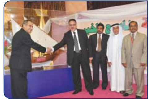
Sitra Charity Fund