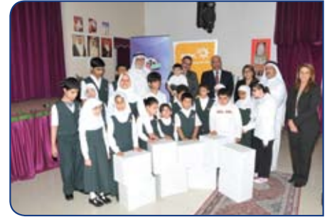
المعهد السعودي البحريني للمكفوفين