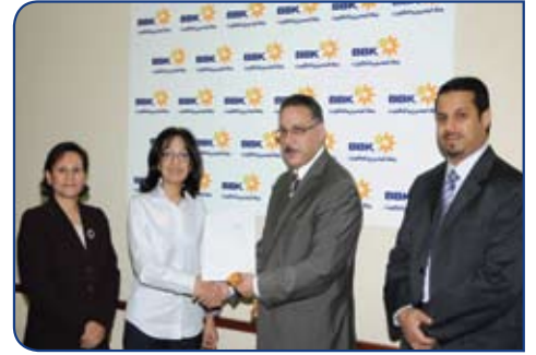
Bahrain Cancer Society