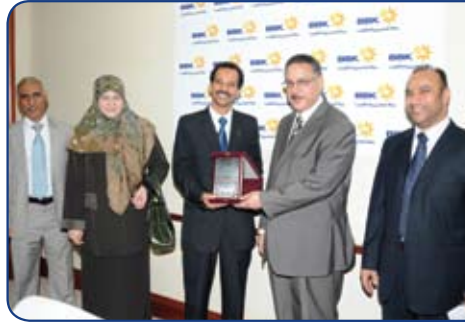
Al Kawther Society for Social Care