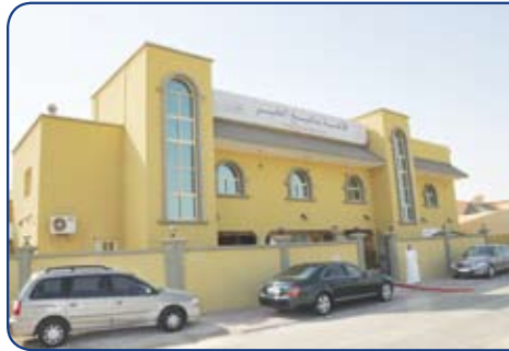
Yanabee al khair Hall

The bank attended the opening of the banqueting hall, built by the Sitra Charity Fund, with the support of BBK.