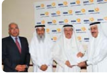
Al Ehsan Welfare Society