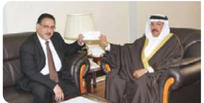
Bahrain Centre for Studies and Research مركز البحرين للدراسات والبحوث