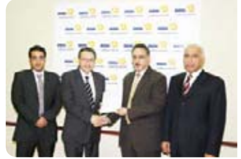
Mohammed Bin Khalifa Bin Salman Al Khalifa Cardiac Centre

مركز محمد بن خليفة بن سلمان آل خليفة التخصصي للقلب