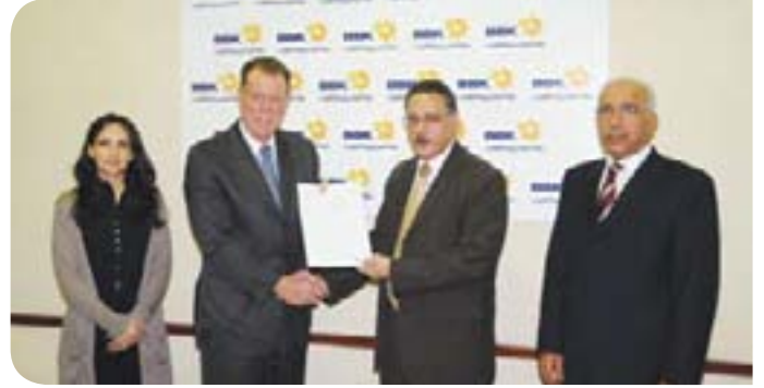
Crown Prince International Scholarship Viability

قوة دفاع البحرين - الخدمات الطبية الملكية