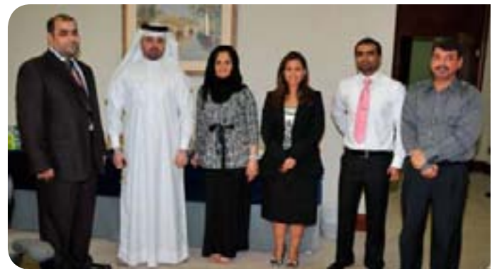
Staff Social Committee members