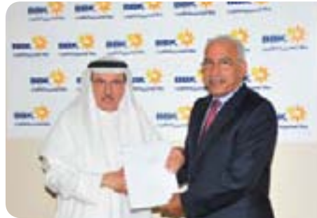
Middle Area Municipal Council