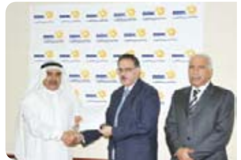
Bahrain Red Crescent Society