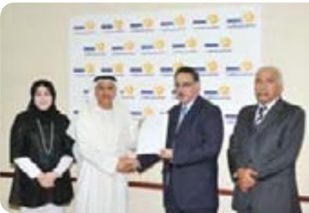
Al Rahma Centre for Youth Care