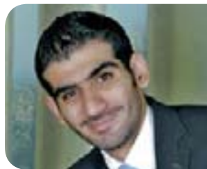
حمد اليوم Hamad Today