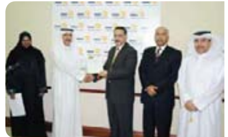
Yuko Parents Care Center & Hidd Rehabilitation Centre for Special Needs

دار يوكو لرعاية الوالدين ومركز الحد لتأهيل ذوي الاحتياجات الخاصة