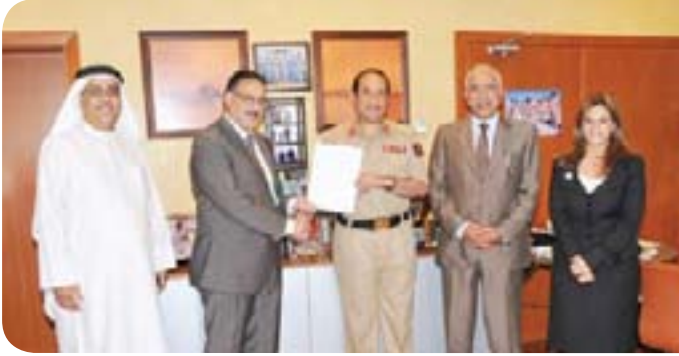
Bahrain Defence Force- Royal Medical Services