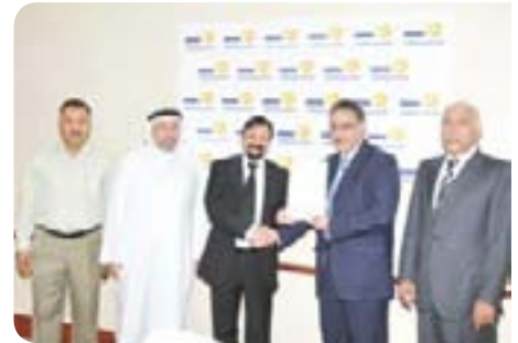
Cerebral Palsy Friendship Society