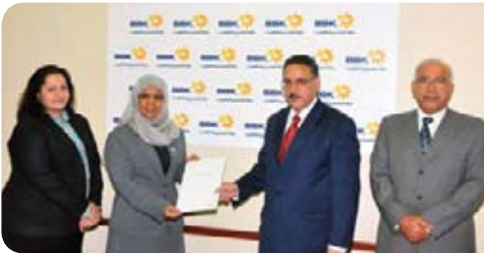
Human Resources Development Fund

برنامج ولي العهد للمنح الدراسية العالمية