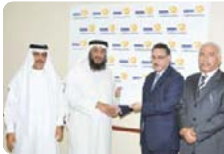
Al Baraka Society