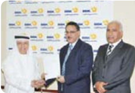
Muharraq Social Welfare Centre

مركز محمد بن خليفة بن سلمان آل خليفة التخصصي للقلب