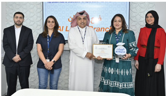
AI Liwan branch