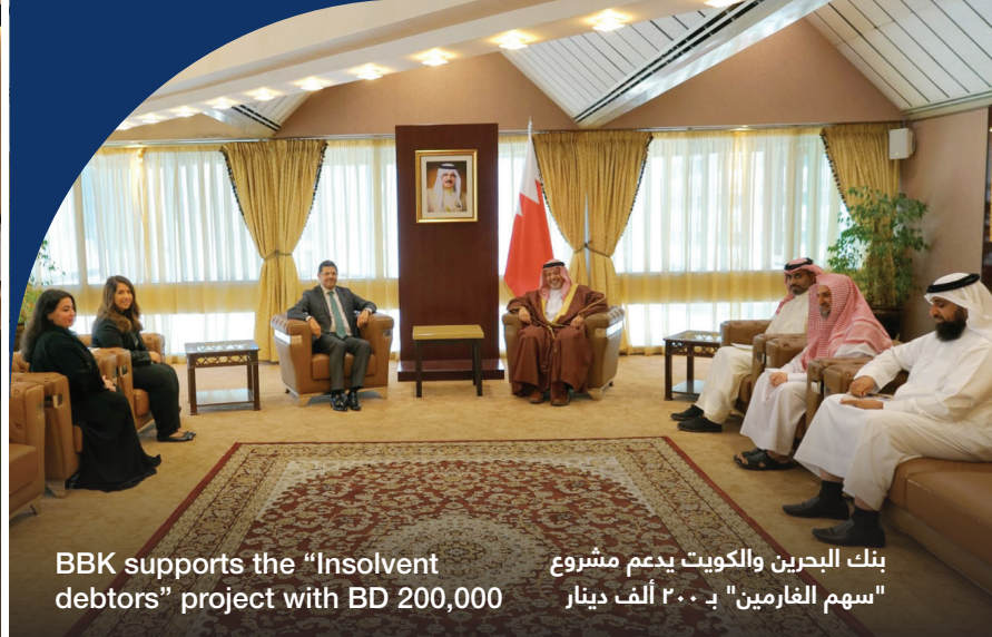
بنك البحرين والكويت يدعم مشروع "سهم الغارمين" بـ ٢٠٠ ألف دينار BBK supports the "Insolvent debtors" project with BD 200,000