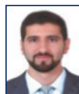
Adnan Jameel Al Ameer International Banking