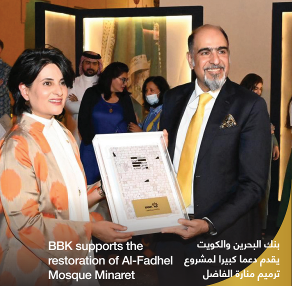
بنك البحرين والكويت يقدم دعماً كبيراً لمشروع ترميم منارة الفاضل BBK supports the restoration of Al-Fadhel Mosque Minaret