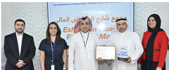
Exhibition Road FM