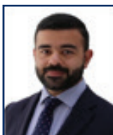
Naser Mohamed Al Alawi International Banking