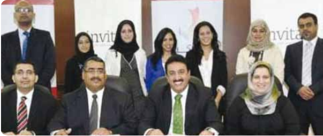
Group photo of the agreement