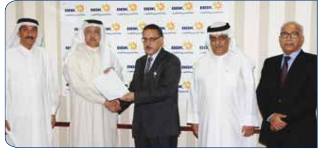
Al Manar for Parents Care