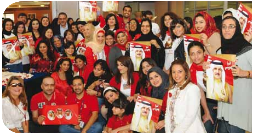
صورة جماعية للموظفين أثناء الاحتفال