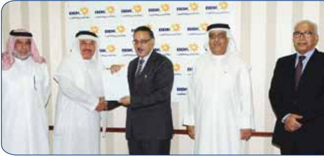
Bahrain Down Syndrome Society