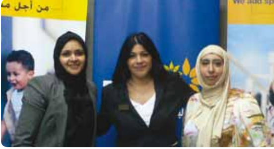
Close up shot of the BBK Kuwait employees

The Human Resources Department – BBK Kuwait Branch participated in the Annual Job Fair Exhibition which took place at the American University of Kuwait on May 3. This job fair showcased various jobs offers and opportunities to fresh graduates and introduced them with the Banks system and work regulations.