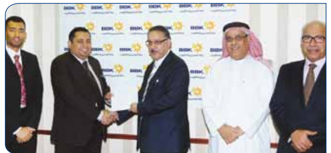
Bahrain Society for SCD Patients Care