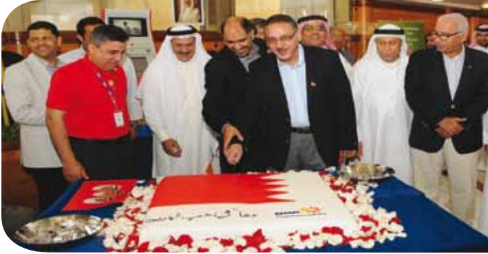
Executive Management members sharing the joy of the celebration

وقد عبر الموظفين عن خالص فرحتهم وامتنانهم بهذا اليوم وهم يرتدون ثياباً بألوان علم مملكة البحرين وتم خلال الحفل رفع صور القيادة الرشيدة والتهاتف بحب القيادة وعلى رأسهم جلالة الملك المفدى الملك حمد بن عيسى آل خليفة، وصاحب السمو الملكي الأمير خليفة بن سلمان آل خليفة رئيس الوزراء الموقر وصاحب السمو الملكي الأمير سلمان بن حمد آل خليفة ولي العهد نائب القائد الأعلى، داعين الله سبحانه وتعالى أن يمن على قيادة المملكة بالخير وطول العمر.