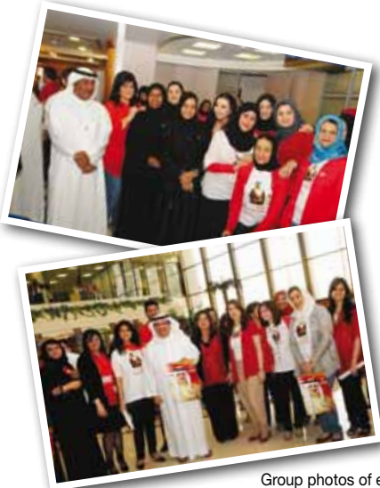
Group photos of employees during the celebration

In support of this special day, the employees expressed their happiness and joy as they wore the colors of the Bahraini flag. Joyful chants of glee were heard in support of the Kingdom and its leaders.