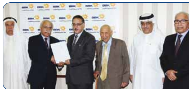
The Bahrain Historical and Archaeological Society