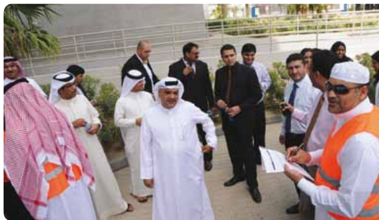
A snapshot of the Exercise

أشاد ممثلو الدفاع المدني بمدى التزام بنك البحرين والكويت وكابينوفا في تنفيذ عمليات الاخلاء وحرصهم على سلامة وأمن موظفيها. مع تنفيذ هذه العملية بنجاح، يكون بنك كابينوفا قد قارب على الانتهاء من تنفيذ برنامج إدارة استدامة الأعمال الإدارة BCM.