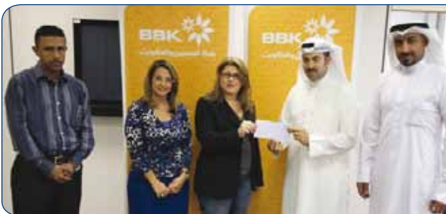
Bahrain Deaf Sport Club