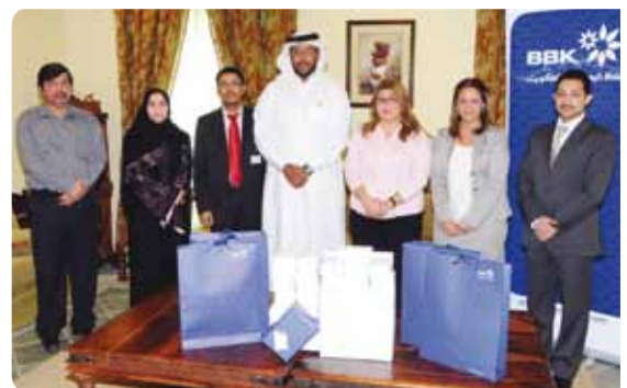
ممثلو من بنك البحرين والكويت ودار بتلكو لرعاية الطفل Representatives from BBK and Batelco Child Care Home

Representatives from the Corporate Communications Department and the Staff Social Committee presented gifts to the orphans on behalf of the Bank's employees. The gifts were funded by donations amounts from the employees during the Bank's 2010 annual staff party. The gifts reflect the employees' belief in the importance of the role they play, each one individually and as a group in the Bahraini community.