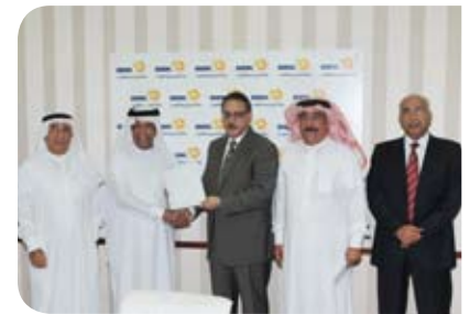
جمعية البحرين الخيرية Bahrain Philanthropic Society