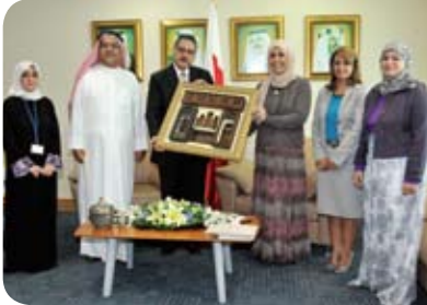
وزارة التنمية الإجتماعية- صندوق العمل الإجتماعي الأهلي Ministry of Social Development- NGO's Support Fund