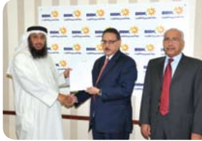
جمعية البركة الخيرية Al Baraka Society