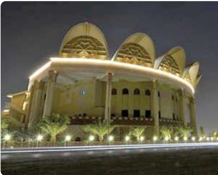
Isa Cultural Hall