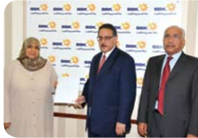
المؤسسة البحرينية للتربية الخاصة Bahrain Institute for Special Education