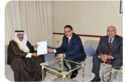
مركز البحرين للدراسات والبحوث Bahrain Centre for Studies & Research