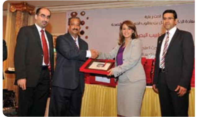
Bahrain Medical Society جمعية الأطباء البحرينية