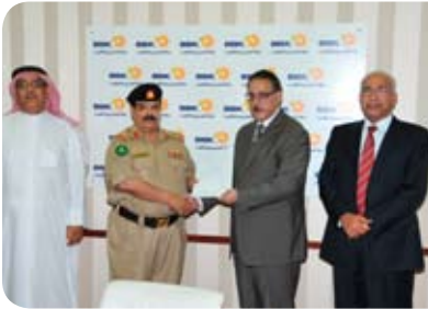
الإتحاد البحريني لرياضة المعاقين Bahrain Disabled Sports Federation