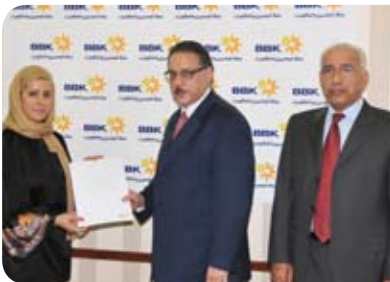
مركز خطوات التأهيل Steps Rehabilitation Center