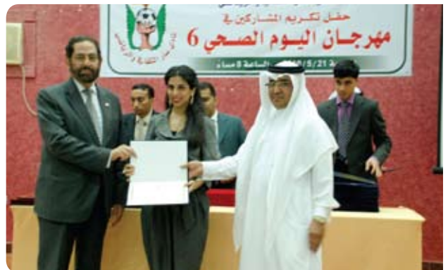
Saar Cultural and Sports Club نادي سار الثقافي والرياضي