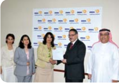
مركز عائشة يتيم للإرشاد الأسري Aisha Yateem Family Counselling Centre