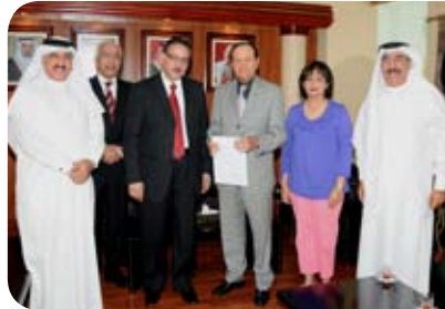
الجمعية البحرينية لتنمية الطفولة Bahraini Society for Child Development