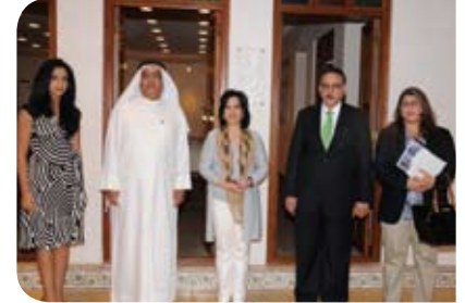
مركز الشيخ ابراهيم بن محمد آل خليفة للتثقافة والبحوث Sh. Ebrahim bin Mohammed Al Khalifa Center for Culture and Research