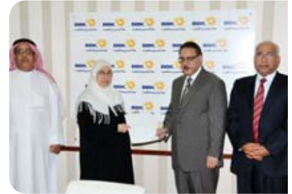
الجمعية البحرينية لأولياء أمور المعاقين وأصدقائهم Bahrain Association for Parents and Friends of the Disabled