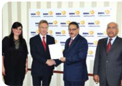
مستشفى الإرسالية الأمريكية American Mission Hospital