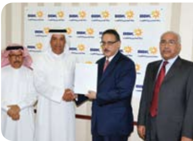
مركز المحرق للرعاية الإجتماعية Muharraq Social Welfare Centre