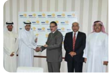
جمعية الصم البحرينية Bahrain Deaf Society