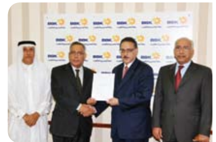
جمعية أصدقاء مرضى الكلى البحرينية Bahrain Kidney Patients Friendship Society