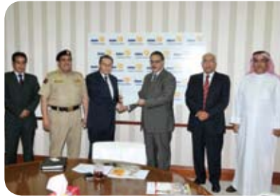
مركز محمد بن خليفة بن سلمان آل خليفة التخصصي للقلب Mohammed Bin Khalifa Bin Salman Al Khalifa Cardiac Centre