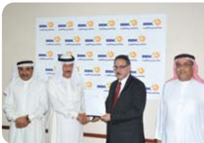
جمعية الهلال الأحمر البحريني Bahrain Red Crescent Society