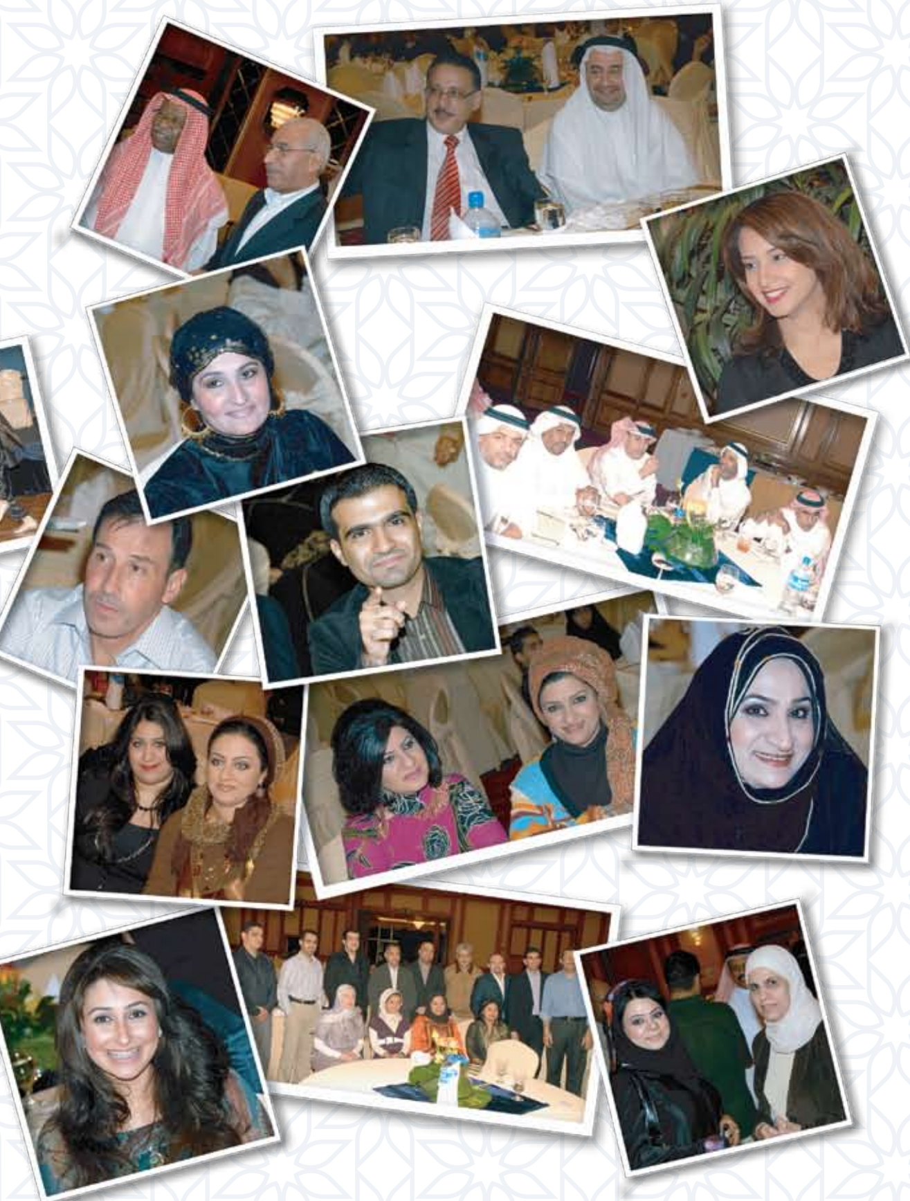
The bank annual dinner 2007