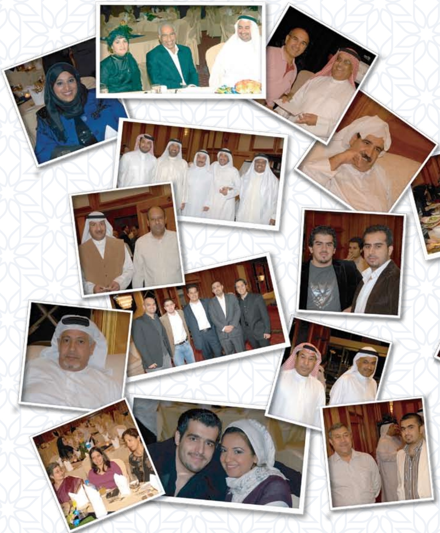
The bank annual dinner 2007