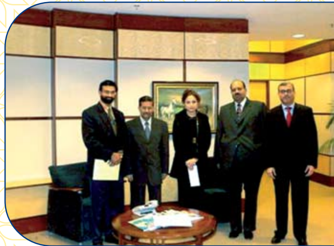
يناير ٢٠٠٨ السيد كاي في بول